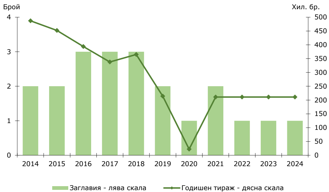
Фиг. 2. Издадени вестници (заглавия и годишен тираж) в област Кюстендил през периода 2014 - 2024 година

През 2024 г. в област Кюстендил е издаван един регионален вестник с годишен тираж 211 хил. броя. Спрямо предходната година броят и годишният тираж остава без промяна.